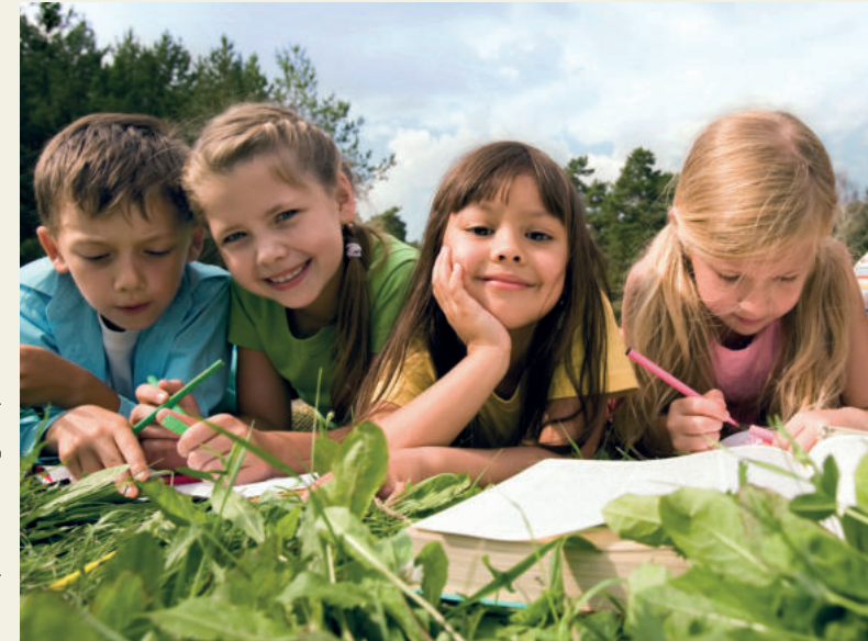
Text: Annika Horstik, VDN