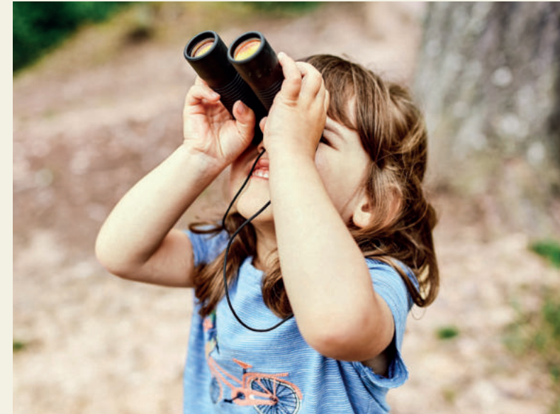
Text: Annika Horstick, VDN